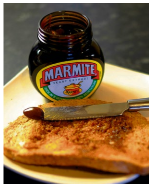
Le célèbre produit a disparu de certains supermarchés.

LONDRES Le Marmite, pâte à tartiner chère aux British, n'est plus distribué par Tesco. En cause, la hausse des prix.