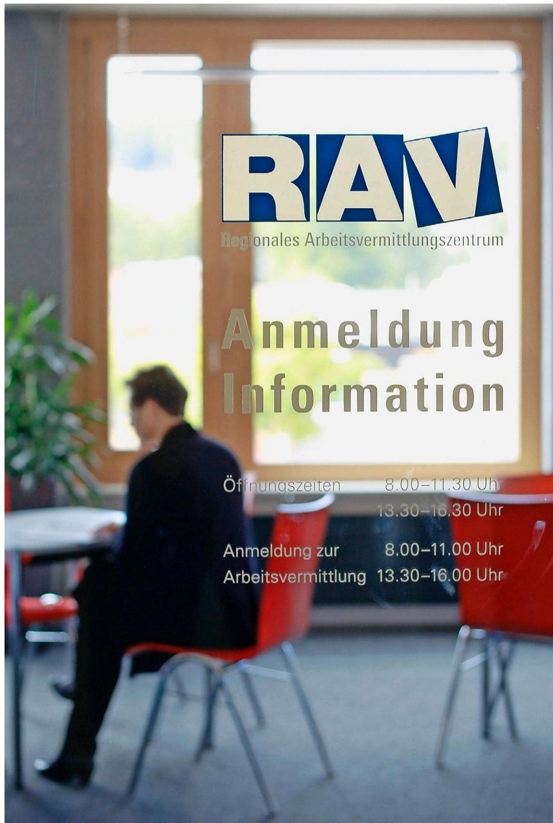
RAV-Software nimmt keinen automatisierten Abgleich zwischen Stellen- und Bewerberprofil vor

Müller zufolge sind insbesondere die Rückmeldungen der RAV über geeignete Kandidaten an Arbeitgeber zentral. «Sie sind ent-